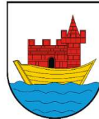
MIASTO I GMINA SĘPOLNO